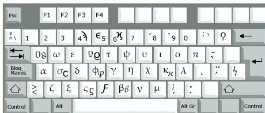
Figura 2: tastiera con Sibylla

Se volete infatti utilizzare la tastiera in modo agevole, spuntate Diccionario e selezionate anche il lessico che preferite da Menu → Herramientas → Diccionario. Le parole digitate verranno riconosciute e corrette automaticamente ma prima di scrivere verificate nella fig. 2 sotto la corrispondenza dei tasti con i caratteri greci nella keyboard con Sibylla.