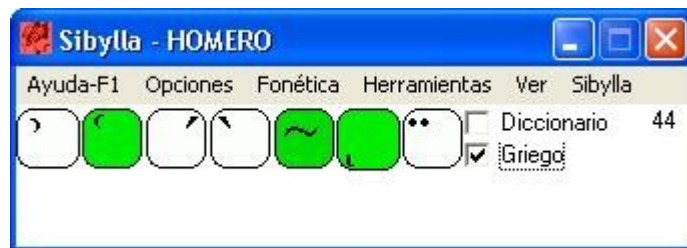
Fig 1: pop up Sibylla

A questo punto si apre il POP UP (come nella fig.1) che consente di selezionare preventivamente i segni diacritici, se vogliamo scrivere digitando le parole senza riconoscimento automatico, ma è preferibile scrivere fruendo del Dizionario interno, base o esteso, o dei Lessici di autori vari.